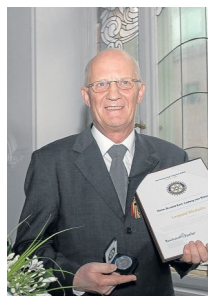
Der Autor bei der Verleihung der Leopold Medaille